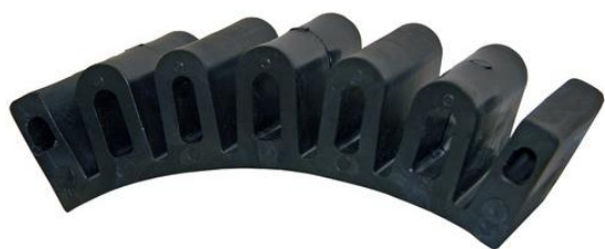
PE 100 elektroforankring, NRF-nr. 244 70 19

Elektroforankringen brukes ved forankring av PE trykkrør i betong. Kreftene fra røret overføres via elektroforankringene til betongveggen. Antallet som normalt er nødvendig per dimensjon og rørklasse finner du i tabellen under. Forankringene er dimensjonert for en last på 42,3 kN per stk.