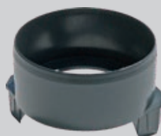
Loddrett utløp Ø 110 mm