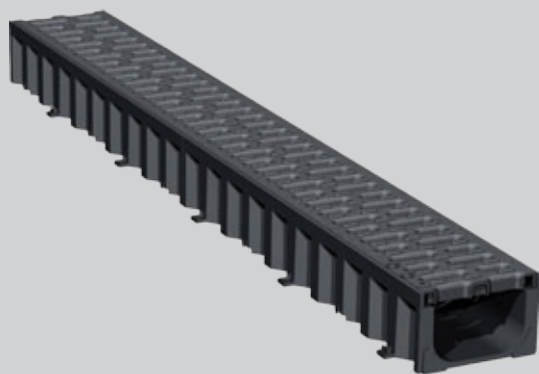
1 meter sort plastrenne med plastrist (1000x130x80)