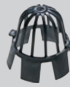
Løvfanger (hindrer løv etc. i avløpet)