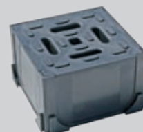
Hjørnestykke (kan tilkobles på alle fire sider)