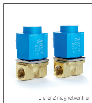
1 eller 2 magnetventiler