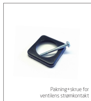
Pakning+skruer for ventilens strømkontakt