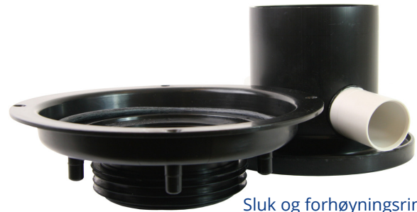
Sluk og forhøyingsring MED anboring

Montering av Pili- forhøyingsring med anboring, utføres på følgende måte: