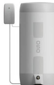
OSO Charge montert sammen med SAGA Xpress SX bereder.