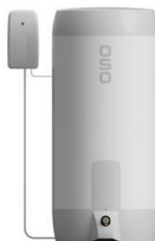
OSO Charge montert sammen med SAGA S 200 bereder.