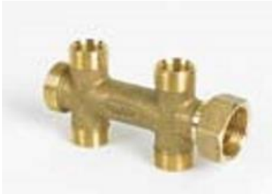
1/2"x3/4" Fordeler med løpemutter og teflonpakning.

Material som er benyttet er drikkevannsgodkjent messing. Teknisk godkjenning: TG 20359 2014 (SINTEF Certification 20359). Produktsertifikat nr. 0086 (R09).