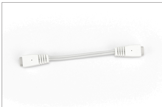
Skjøtestykke for sensortape