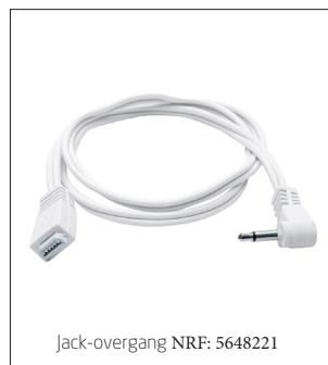
Jack-overgang NRF: 5648221