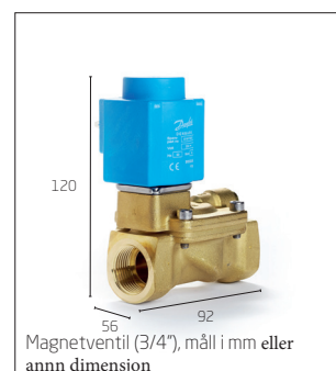
Magnetventil (3/4"), mål i mm eller ann dimension