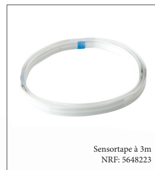
Sensortape à 3m NRF: 5648223