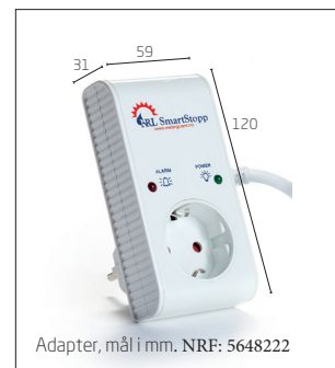
Adapter, mål i mm. NRF: 5648222