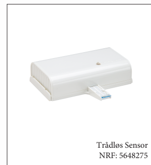
Trådløs Sensor NRF: 5648275